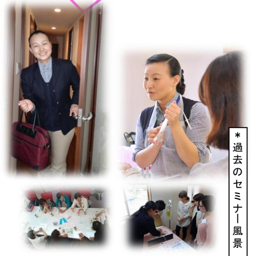
*過去のセミナー風景