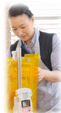
(在宅用 輸液ポンプ)